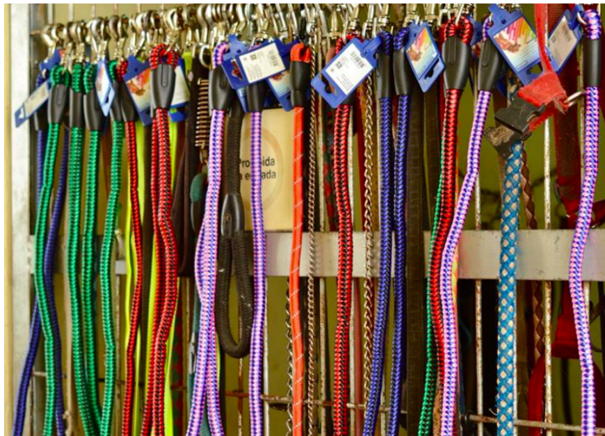
Corretges per passejar els cans.