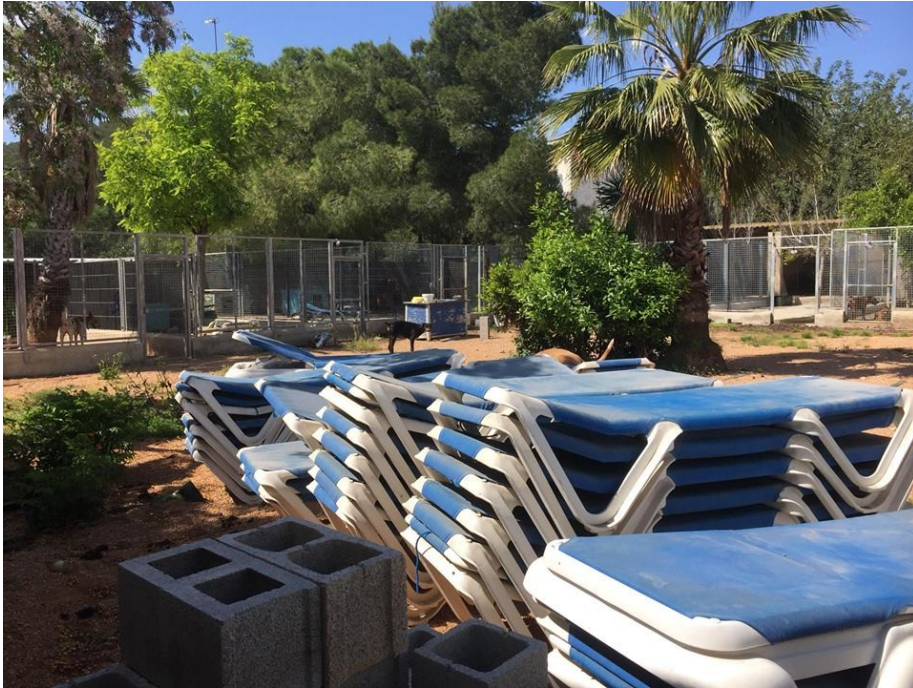
Hamaques de tela on pugen els cans