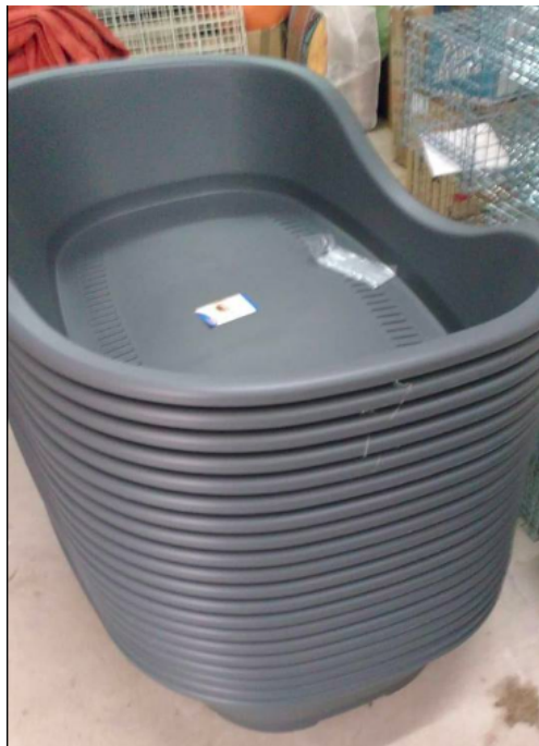
Llits per als cans