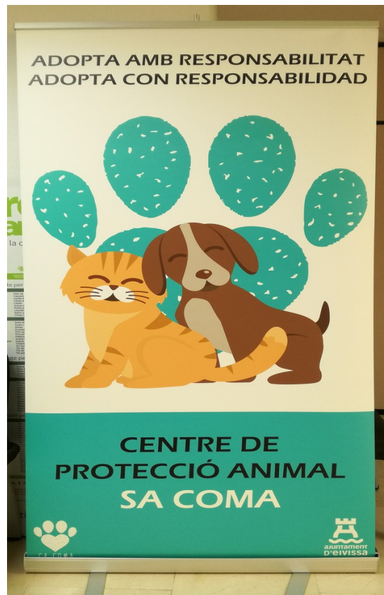
Roll up per esdeveniments