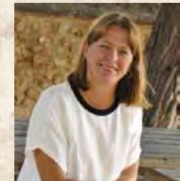
Virginia Marí Rennesson Alcaldesa de Eivissa

Os invito a todos a disfrutar de unos días festivos llenos de actividades... ¡Bienvenidos a la Eivissa Medieval!