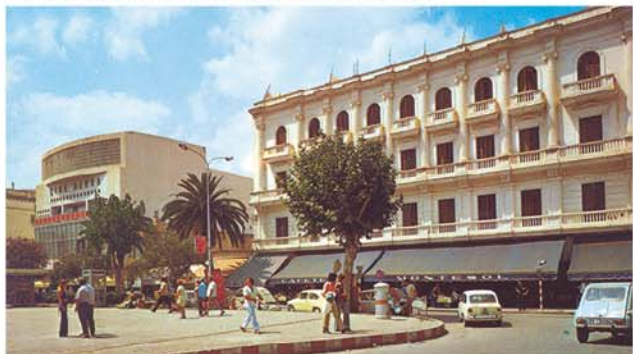
L'hotel Montesol i l'inici del passeig. 1973.

El mes d'abril de 1915, el Ple de l'Ajuntament aprovava enllumenar el passeig amb arcs voltaics. L'any 1932, la Caja de Pensiones para la Vejez y de Ahorros, «la Caixa», inaugurava la primera biblioteca pública de la ciutat. En el mateix lloc, la mateixa entitat bancària va obrir també un Museu Etnològic. A poc a poc, els voltants de s'Alamera s'anaven omplint de comerços i espais públics que han ajudat a escriure la història del barri i de la ciutat.