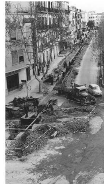
Fons Municipal. Anys 60 segle XX. AISME

de la plaça de la Constitució, al barri de la Marina. Més endavant s'acordaria dedicar-li el passeig de s'Alamera i la creació d'una comissió de festes i una sèrie de subcomissions per tal d'organitzar activitats que havien d'impulsar i acompanyar la construcció i inauguració del monument, que fou obra de l'escultor Eduard Alentorn i de l'arquitecte August Font i Carreras. El 14 de juliol de 1901 es posava oficialment la primera pedra. El juny de 1902 arribaven al port d'Eivissa les vint-i-cinc pedres de la base i el novembre de 1903 les peces per acabar el monument. L'obra quedava acabada a principi del mes de gener de 1904 i s'inaugurava el 25 d'abril d'aquell any, amb la presència d'Alfons XIII.