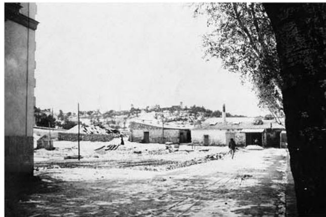
El cap de s'Alamera nevat. Desembre 1962.

1 Llibre de Regidoria 1724-1725 . Administració Municipal. AHE