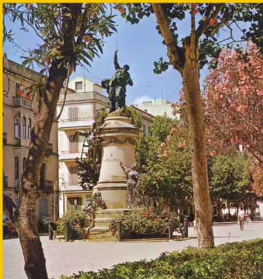
Casa Planas. 1969. Abans de la pavimentació realitzada en la dècada següent. AISME