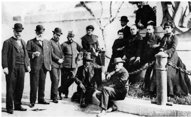
La família Vara de Rey i la Comissió del Monument. 1904. AISME