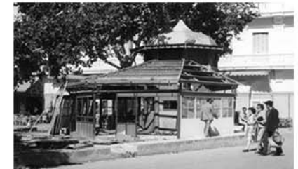
Demolició quiosc del passeig. Octubre 1960.

La urbanització dels voltants del passeig començaria en la dècada següent. Un dels seus protagonistes fou l'aleshores arquitecte provincial Josep Alomar. L'Ajuntament d'Eivissa aprovava en la sessió plenària del 31 d'agost de 1912 les condicions tècniques que havien de tenir les construccions que s'anassin aixecant a la zona. A poc a poc, s'anava configurant el passeig i