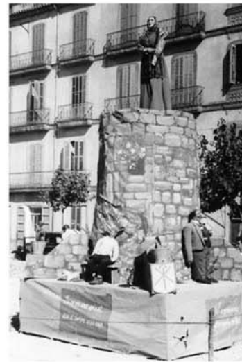
Foguerons de Sant Joan. Anys 50 del segle XX.

L'1 de juliol de l'any 1898, el general Joaquin Vara de Rey y Rubio, nascut a Eivissa el 14 d'agost de 1841, moria a la batalla de Caney (Cuba). Cinc dies després es publicava a la premsa local que el militar podia haver nascut a Eivissa. Poc després, l'aleshores batle de la ciutat, Josep Verdera Ramon, localitzava el seu certificat de baptisme, l'Ajuntament el nomenava Fill Illustre i donava el seu nom a un carrer de la ciutat, al costat